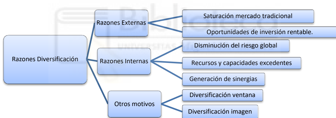
Figura 3 → Razones de diversificación.