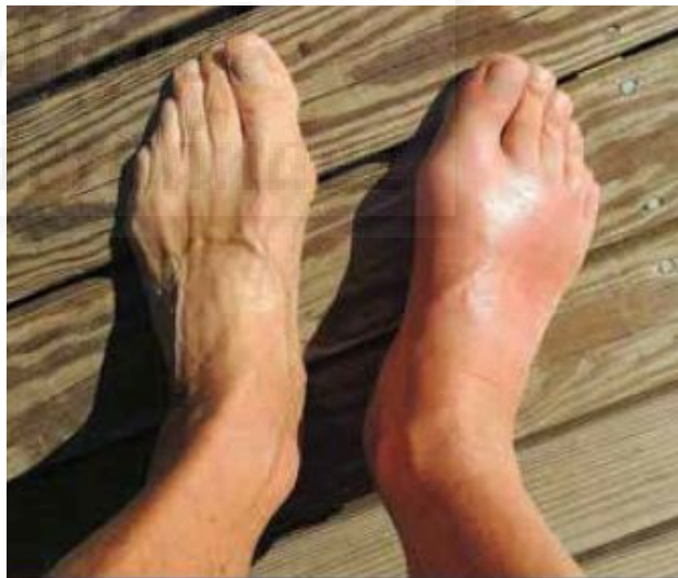
Ilustración 1

Eritema en la articulación afecta, articulación muy sensible al tacto y movimiento muy limitado 4 son los síntomas clínicos que nos podemos encontrar en un ataque doloroso de gota.