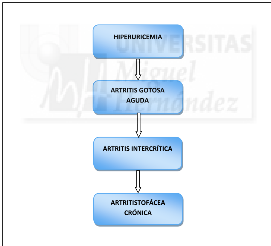
Ilustración 2 Fases de presentación de la Gota.

La historia natural de la gota puede esquematizarse en cuatro fases: