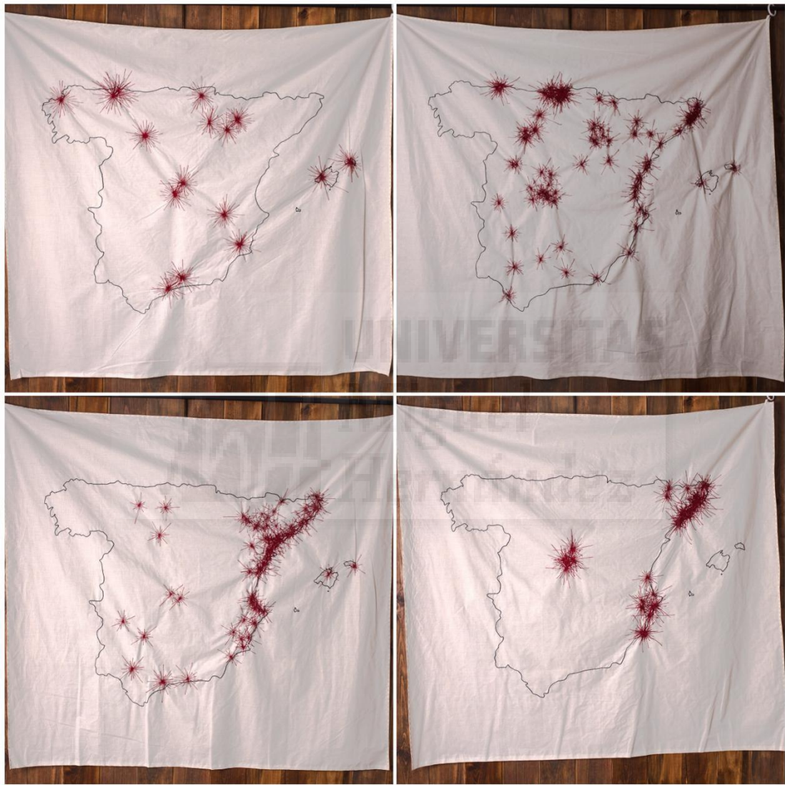
Fig. 3 ( de arriba a abajo): 1996, algodón bordado con hilo de algodón (150 x 150 cm), 2019 // 1997, algodón bordado con hilo de algodón (150 x 150 cm), 2019 // 1998, algodón bordado con hilo de algodón (150 x 150 cm), 2019// 1999, algodón bordado con hilo de algodón (150 x 150 cm), 2019