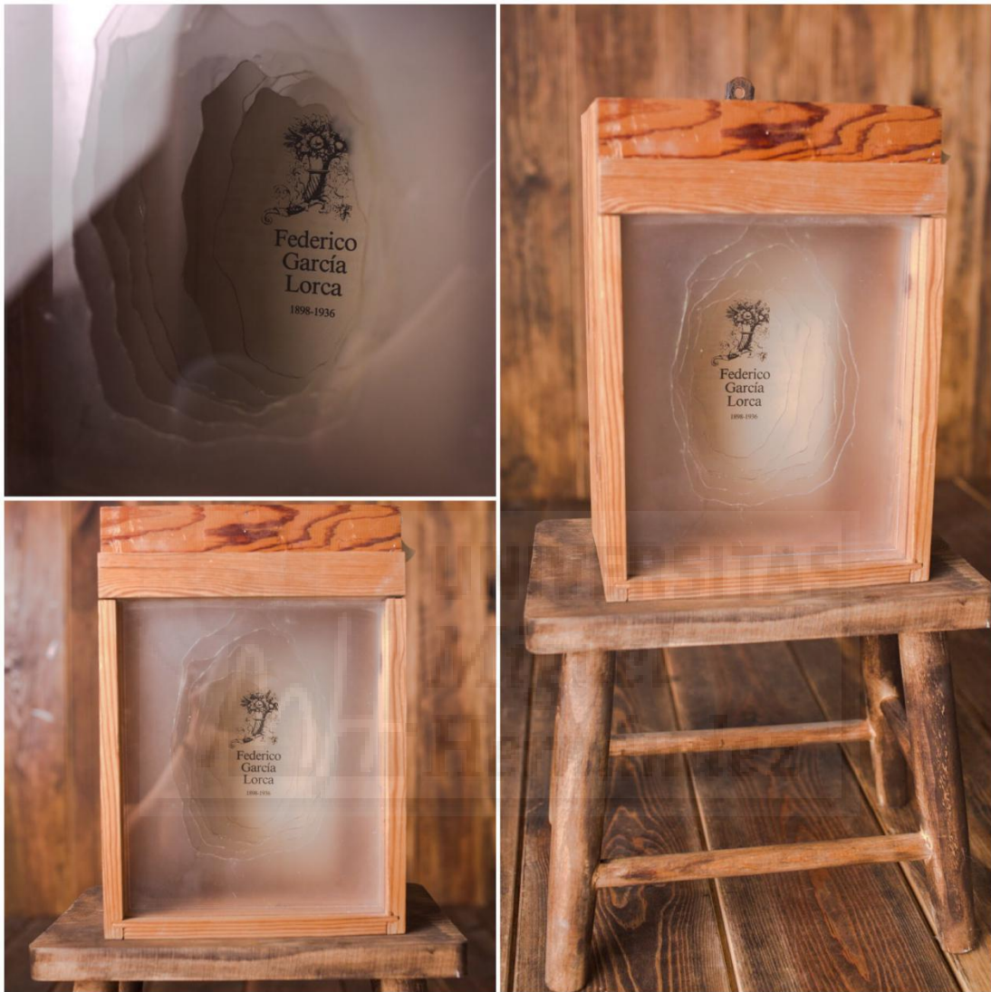
Fig. 10: Lorca , poemario de Lorca, caja de telefono de iberdrola, metacrilato, cristal (30x20x23 cm) 2019

Las piezas son capaces de funcionar en conjunto, en una exposición todas ellas relacionándose y conversando entre ellas, aportando matices las unas de las otras. Pero también funcionan de manera individual siendo diferentes entre ellas tanto en materiales como en formas.