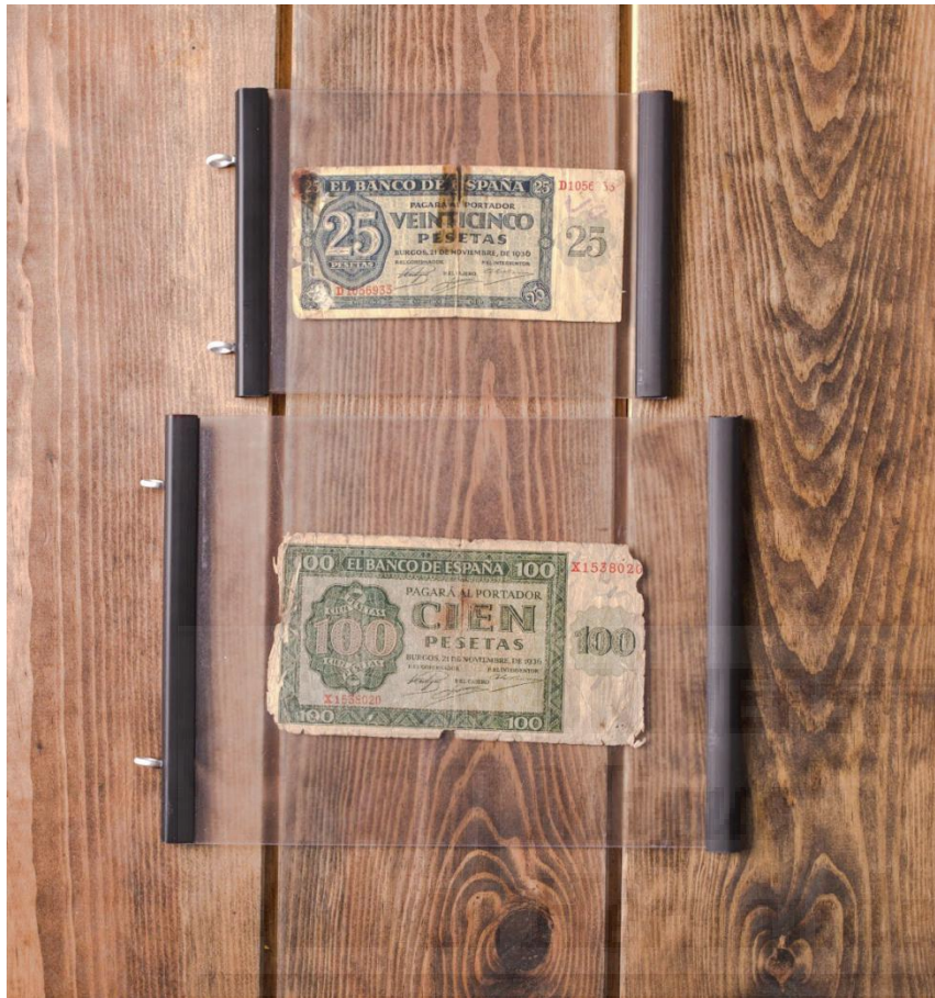
Fig. 6: Billetes de la república, acetato y billetes (dimensiones variables), 2019