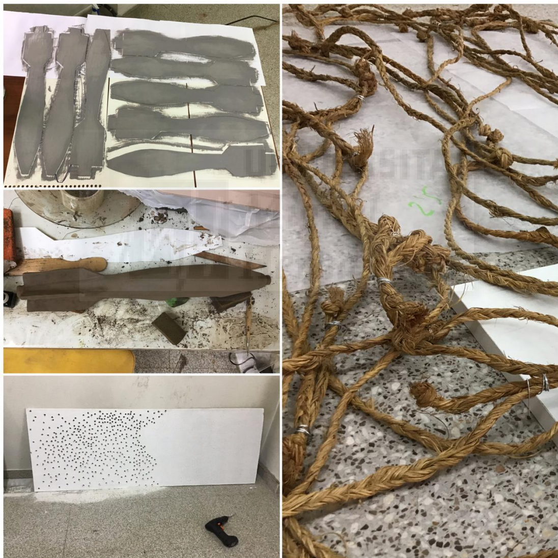
Fig. 2 (de arriba a abajo): Bombas de metal durante el lacado// Bomba de cerámica durante el proceso de creación// Placa de pladur durante el proceso de creación// Medición y numeración de los vencejos

Todas ellas han tenido un bocetaje y una maquetación previa para saber como funcionarían mejor y como sería la manera más correcta y eficiente de llevarlas a cabo. Cada una de las piezas tiene un proceso diferente ya que los materiales con los que se trabaja son diferentes entre ellas. Y estando todas relacionadas no tienen nada que ver en cuanto a forma y confección.