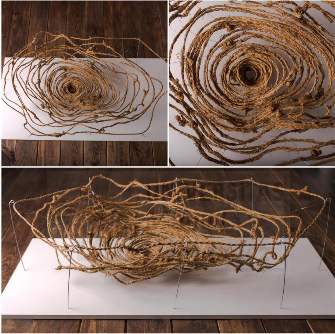
Fig. 9: 34, vencejos de esparto, madera y barillas de metal (120x50x30 cm), 2019