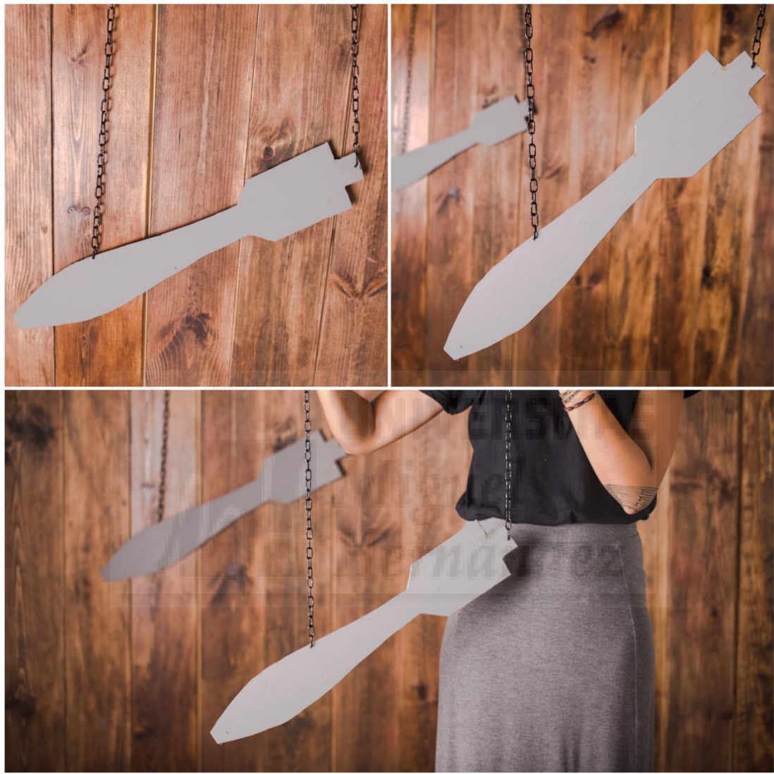
Fig. 4: Bombardeo , ocho planchas de metal cortadas a medida (63x10 cm), 2019