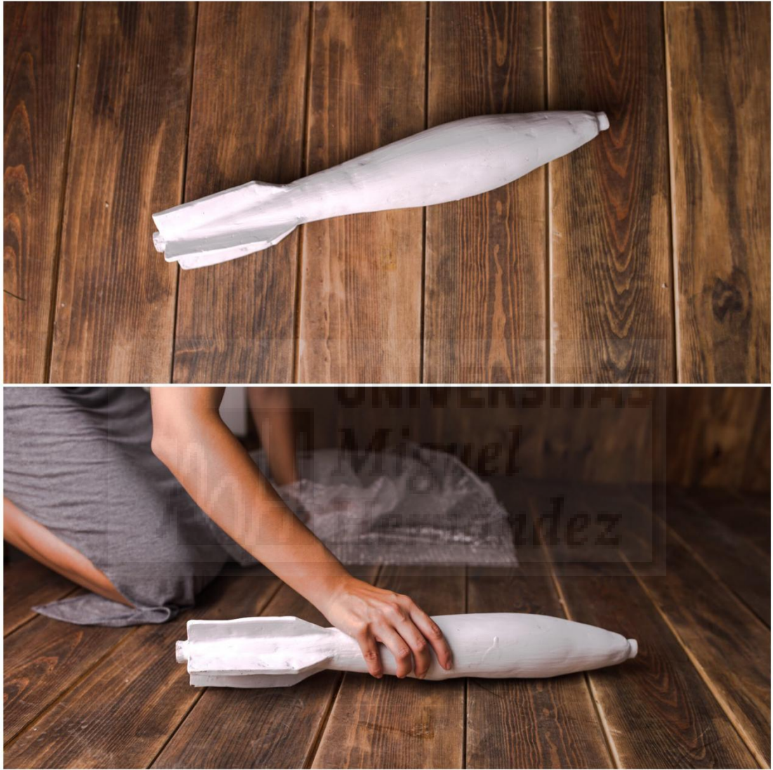
Fig. 5: Bomba, cerámica sin coción (63x10 cm), 2019