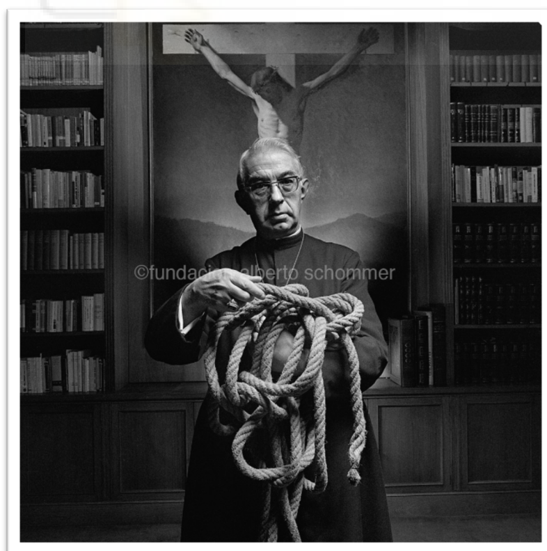
Figura 6: Enrique Tarancón, 1969 - 1973