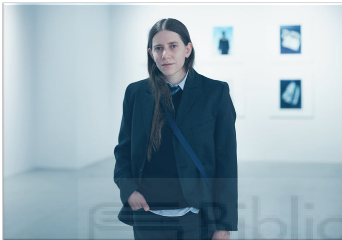
Fig 2. Coco Capitán, por Naoya Takahashi. Mayo, 2022 Fuente: https://imaonline.jp/articles/interview/20220506coco-capitan/#page-1

María de las Mercedes Capitán, más comúnmente conocida como Coco Capitán, es una artista sevillana que trabaja como fotógrafa para grandes marcas de moda como Gucci y Nike, firmas en las que ha podido incluir su identidad y crear proyectos propios a partir de esto. En el caso de Coco Capitán, ya no es la fotógrafa quien se adapta a las necesidades de la marca sino la marca quien persigue el estilo y creatividad fotográfica. Entre sus trabajos más destacados, destaca la colaboración que hizo con el creativo de Gucci, Alessandro Michele,