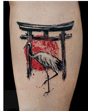
(p.e. Fig. 1. https://muscat-tattoo.com/ )

El primer tatuador referente de este proyecto es Asao. Tatuador japonés que trabaja para el studio "Studio Muscat" situado en Shibuya (Tokyo, Japón), más conocido en redes como @asao_dd_tattoo. Trabaja mezclando los estilos del arte tradicional japonés y el arte moderno con estética tribal japonesa. La mayoría de sus tatuajes son en negro, aunque también introduce el color en algunos de sus trabajos.