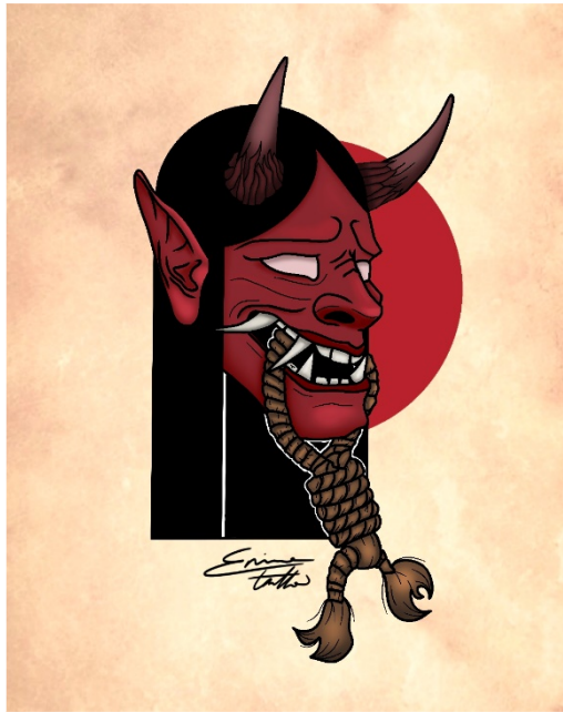
(p.e. Fig. 6. "Oni", ilustración digital, 1080 x 1350 px)