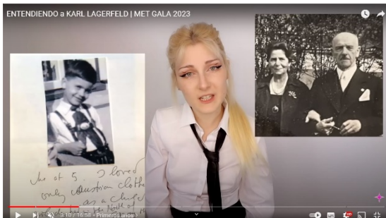
(p.e. Fig. 4. https://www.youtube.com/@JWIBEL )