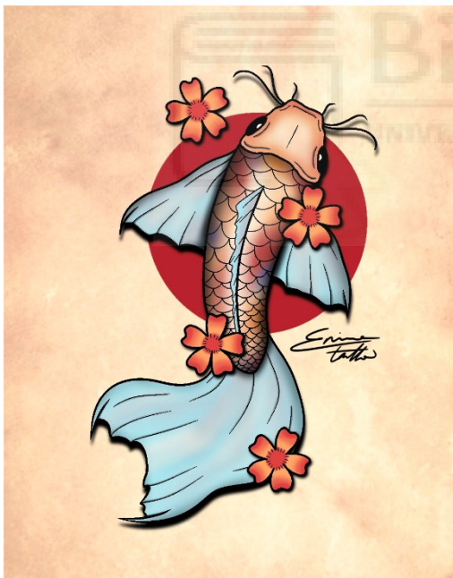
(p.e. Fig. 6. "Koi", Ilustración digital, 1080 x 1350 px)

Enlace al vídeo: https://drive.google.com/drive/folders/1dzCuqhOo6AKonbnM95Benn-Nry5UK3eb?usp=drive_link