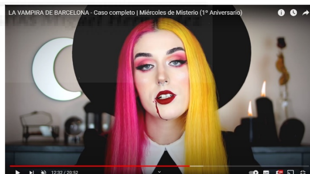
(p.e. Fig. 5. https://www.youtube.com/@thisisdrewtua )

actual. Hablando así de moda, sucesos actuales,