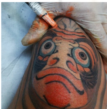
(p.e. Fig. 2. http://horikashi.com/ )

El siguiente tatuador referente es Horikashi. Es un tatuador japonés que trabaja autónomamente en Japón y que recibe