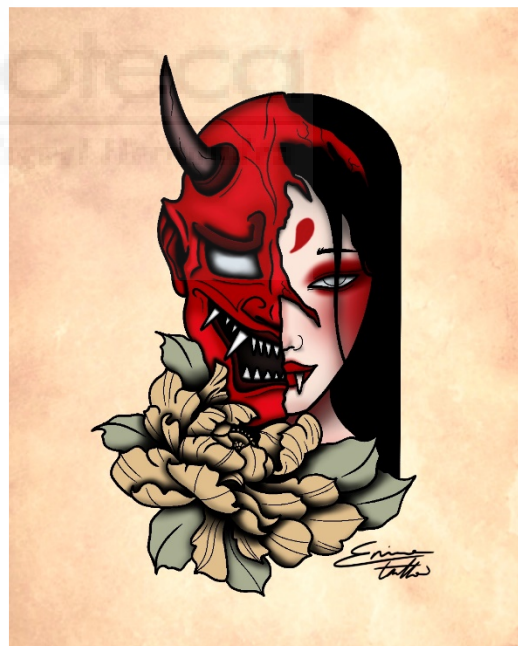
(p.e. Fig. 6. "Hannya", Ilustración digital, 1080 x 1350 px)