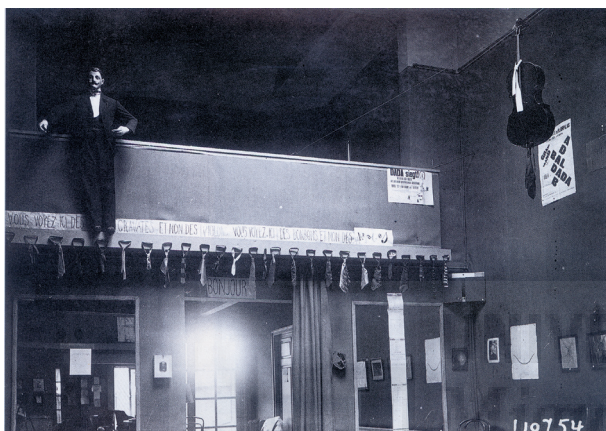
Exposición Dadá. París 1921. Alteración de los modelos expositivos tradicionales.

Un personaje al que se le hace entrega de la responsabilidad absoluta de la ejecución de un acto expositivo artístico. Entre sus atribuciones está la de la elección del lugar de exhibición, la de los artistas participantes, de la obra concurrente, del diseño de la exposición, o en su defecto de la supervisión y control del diseño realizado por otros, así como del catálogo y de cuantas acciones pudieran suscitarse en la celebración. Hasta el punto que, en muchos casos, se le considera el auténtico artífice de la creación artística contemporánea, mientras el artista tan sólo es un eslabón más dentro de esa cadena creativa.