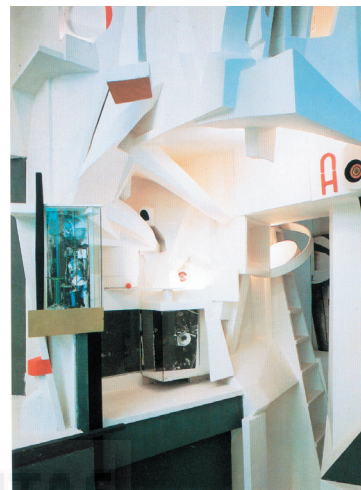
Merzbau, 1918. Expansión de la obra en el local. Kurt Schwitters

La realidad de estos hechos corresponde a la realidad misma de la época histórica donde conviven todos ellos. Circunstancialmente la mayor parte de las convulsiones sociales emerge en esas fechas. Son las décadas de los sesenta y setenta el punto de partida del resquebrajamiento de los muros limitadores de la geografía escénica en los cursos de los procesos creativos de las exhibiciones de las artes plásticas. Y aunque Schwitters, El