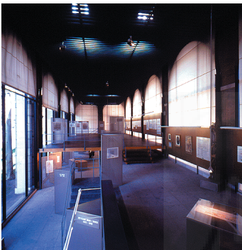
Exposición en la Arquería de los Nuevos Ministerios. Panorámica.

Ahora bien, debemos significar que la referencia a estas actitudes y a las practicadas por Schwitters, con sus Merzbaus a comienzos de los años veinte, los ensayos Proun llevados a cabo por El Lissitsky también por esas mismas fechas, sólo obedece a situar el comienzo de la actitud artística preocupándose por el territorio exhibidor. El propósito de este trabajo se objetúa en la desvelación de la influencia que el lugar ejerce en la consecución del proceso creativo y en la directriz que impone en las decisiones compositivas.