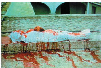
Ana Mendieta, 1976. Body Art. El cuerpo como elemento expositivo.