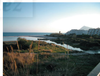
Desembocadura Río Algar, Altea, Alicante. Localización para parque escultórico.

La intención de esta incorporación exhaustiva con el análisis expositivo y de contenido de esta sala de exposiciones, se debe a que quien escribe esto participó de forma directa en la organización de sus exposiciones durante más de una década. Lo que nos permitió investigar los cambios y evoluciones que se producían tanto en el propio edificio, como en cada una de